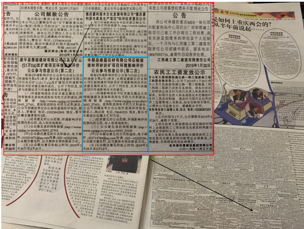
图3 重庆商报1月30日（第一次）公示信息公示