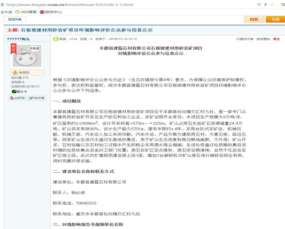
图1 第一次环境影响评价信息公示(网络平台公示)

我单位于2019年1月3日在当地公开网站 http://www.fengdu.ccoo.cn/forum/thread-9313106-1-1.html 重新进行了第一次信息公示,见图1。