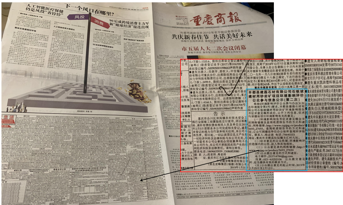
图4 重庆商报2月1日（第二次）公示信息公示